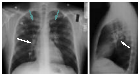
Figure 2 : La radiographie thoracique antéro-postérieure et latérale démontre une protubérance hilare (flèches blanches) et des infiltrats apicaux (flèches vertes).

L'imagerie isotopique au thallium-201 chez les patients atteints de sarcoïdose cardiaque soupçonnée est utile pour identifier une atteinte myocardique et exclure une dysfonction cardiaque due à une coronaropathie. Les examens d'imagerie au repos peuvent simuler la présence de manifestations observées en association avec la coronaropathie mais contrairement à la coronaropathie,