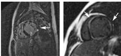
Figure 3 : Exemples d'IRM rehaussée au Gadolinium-DTPA dans la détection de la sarcoïdose cardiaque